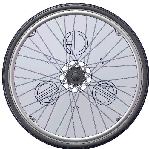
BILD 1. Ekerskydd på hjul