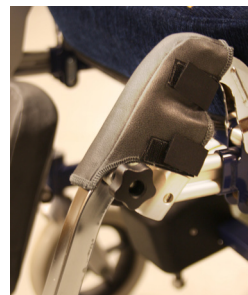
BILD 2. Mjukt knäledsskydd

Mjukt knäledsskydd träas på över benstödetets knäled som ett skydd om brukaren trycker/pressar sina ben utåt mot benstödens överdel.