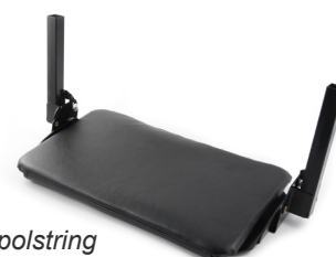
BILD 3. Fotplattspolstring

För brukare som sitter i rullstolen utan skor finns mjuk polstring som tillbehör till Fotstöd helt och Fotlåda.