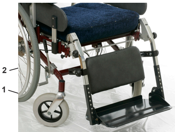
BILD 1. Rullstol med helt fotstöd.