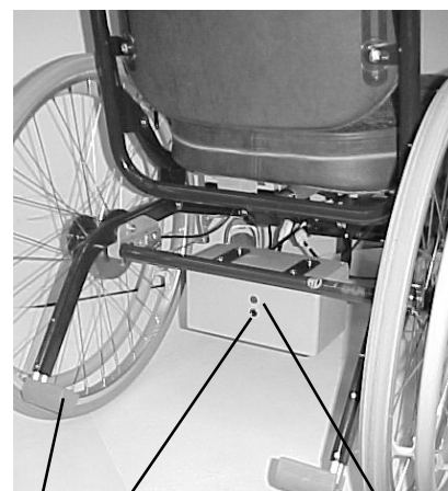
8 7 bild 2b 6

Om säkringen efter återställning åter löser ut eller ofta löser ut är något fel. Kontakta då verkstad.